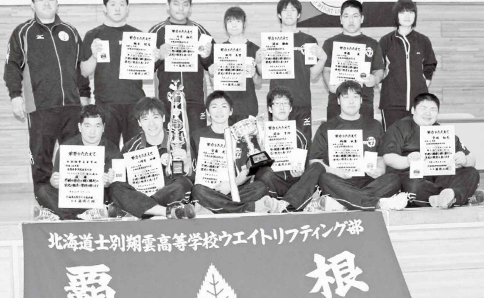
6月13日 全道大会で大活躍!! 5人が全国大会へ ~目指せ!! 全国制覇!!~

国高等学校女子ウエイトリフティング競技選手権大会北海道選考会 北海道教育委員会・北海道ウエイトリフティング協会 後援：札幌市・札幌市教育委員会・(一財)札幌市体育協