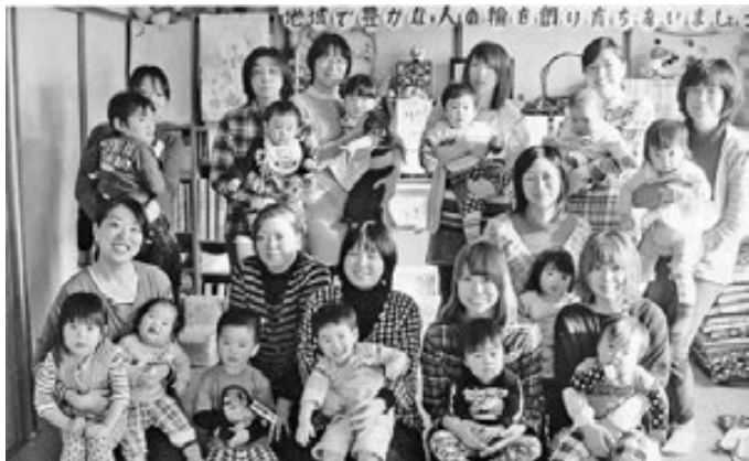
ぴっぴ会も楽しいよ！

※入会を希望される方は、土別おやこ劇場事務局（☎ 22-1246）までご連絡ください。お待ちしております。