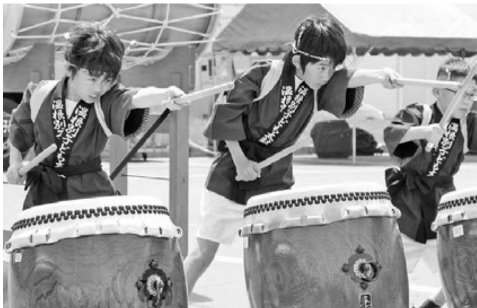
◆5月25日 第18回しべつわんぱくフェスティバル ～温根別子ども太鼓～

息のあった力強い演奏に 観客が引き込まれました。 真剣な眼差しから 子どもたちの一生懸命さが 伝わってきます。