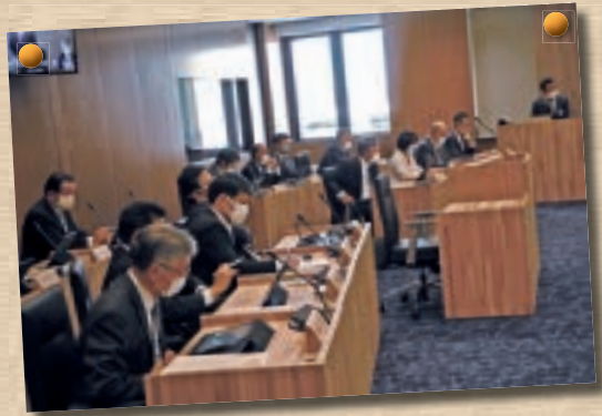
▲新しい議場で議会がスタート！