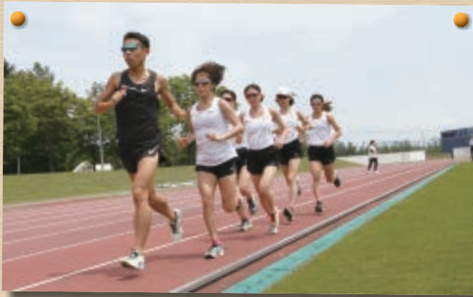
▲コロナに注意しながら合宿シーズン開幕！ トップバッターはダイハツ！