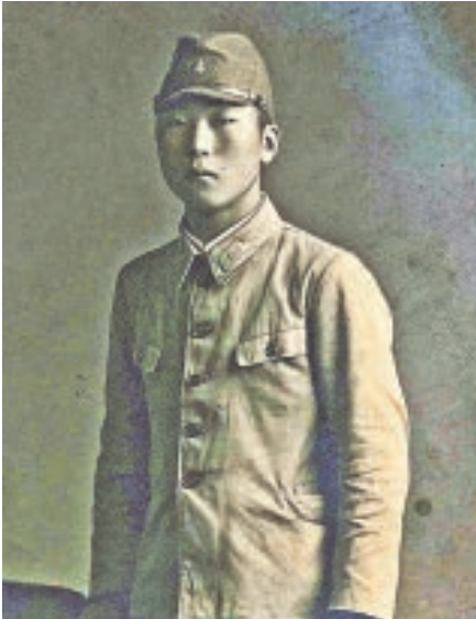
▶ 15歳の貞雄さん。昭和16年に撮影。

ところが、士別に来て4カ月もたないうちに父親が急逝しました。当時私は18歳でしたが、残された家族の事を考えると涙を流す余裕もなく、「これから先どうやって生きていけばいいのか」との思いが先に立ちました。払い下げの西士別町の開拓地を開墾