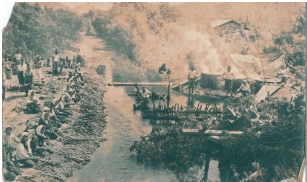
▲軍に供出するためのフキを炊いている様子。右側では男性たちが湯を沸かしており、左側の川沿いでは女性たちがフキの皮をむいている。