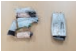
▲処理機の故障や、作業員のけがを招く恐れがあります!