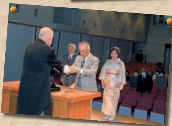
◀九十九大学・大学院が 入学式！