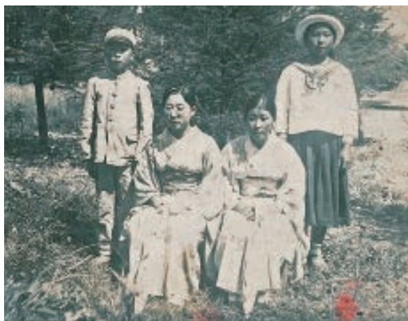
▲貞雄さん（左端）と3人の姉。

義務教育は6年生までで、卒業後は大半が家業で働いたものですが、私は高等科へ進学しました。家から高等科までは16キロもあり、夏は自転車、冬はスキーで通いました。