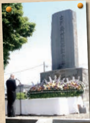
▶先人たちへ感謝と敬意を こめて、開拓記念式を行 いました