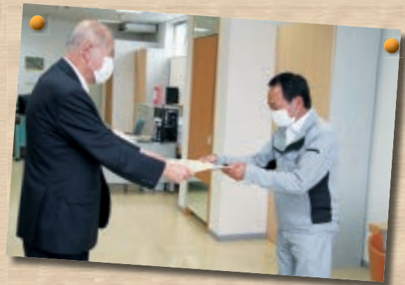
▼社会貢献いただいた事業所に、 感謝状を贈りました☆