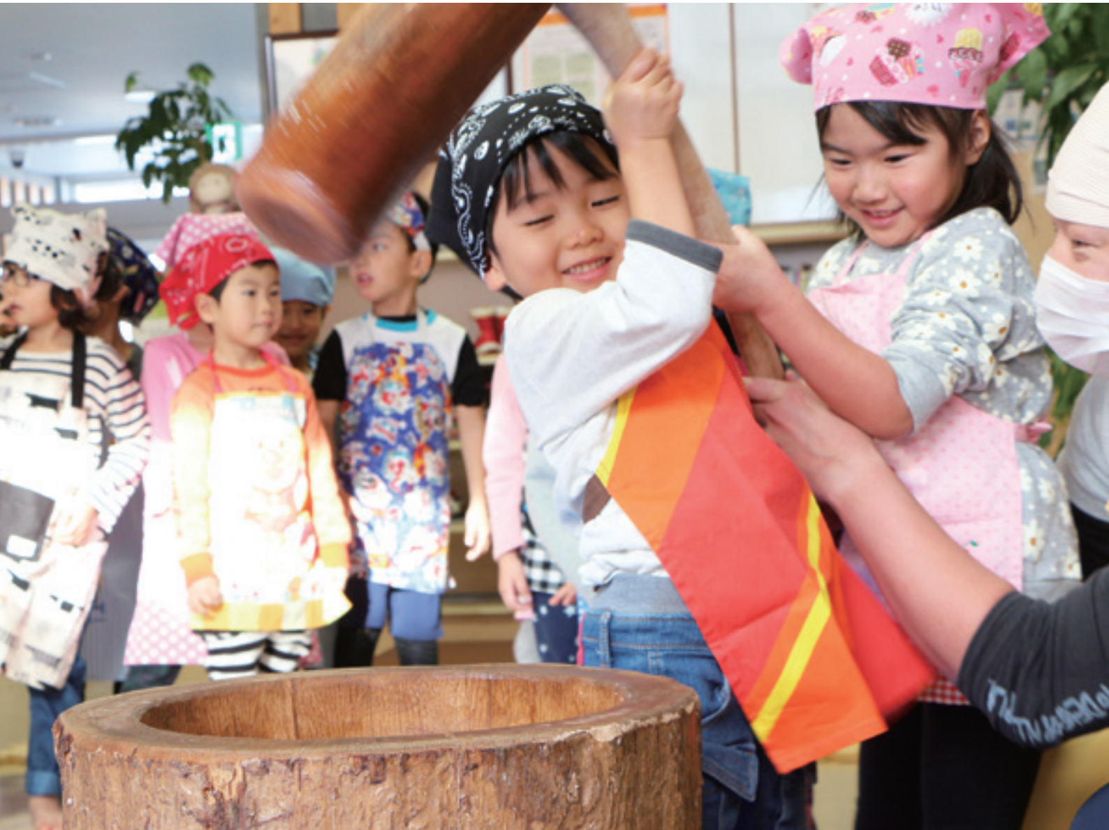
12月5日 あいの実保育園もちつき