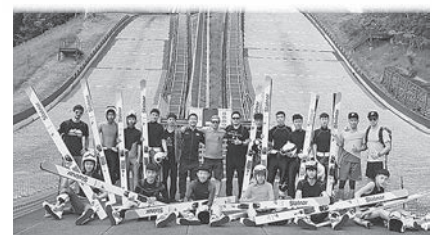
朝日三望台シャンツェでの合宿のようす

シヨナルチームです。昨年7月に、ナショナルチームとしての初合宿を本市で行い、今年で2回目です。 6月2日から12日までの間、選手とスタッフ総勢21人が来市します。