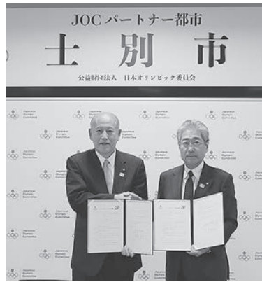
JOC竹田会長との調印式

これまでJOCが行っていた協定は、都市が所有するスポーツ施設をトップアスリートの強化練習に活用し競技力の向上を図る目的でしたが、今年度から、JOCが進めるオ