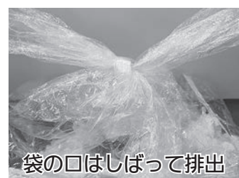
袋の口はしばって排出