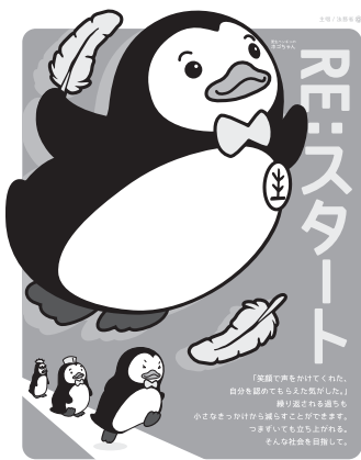
社会を明るくする運動