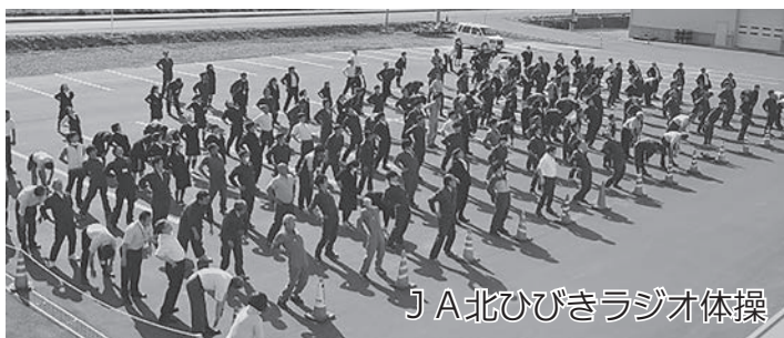
J A北ひびきラジオ体操