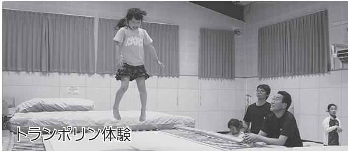
トランポリン体験