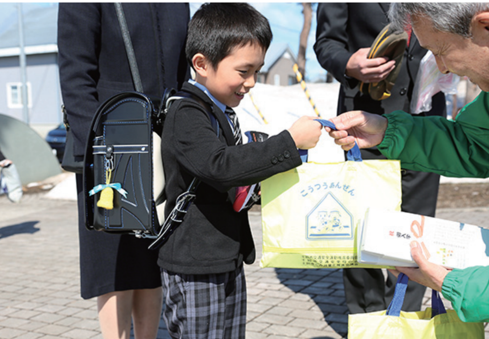
4月8日 新入学児童への交通安全啓発 (土別小学校)