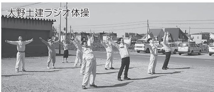
太野土建ラジオ体操