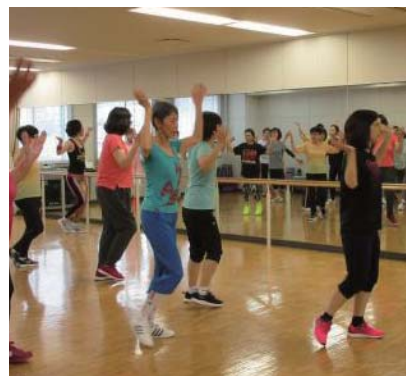
平成30年度支援例 ズンバゴールド体験会 初心者オカリナ教室など

●申込み・問合せ↓申請書を開催日の20日前までに市中央公民館 ☎(23) 3358まで。