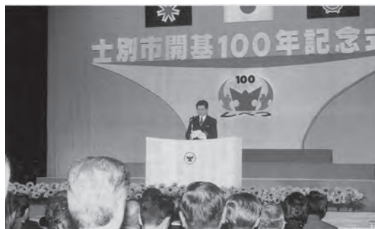
▼平成11年8月 士別市開基100年記念式典