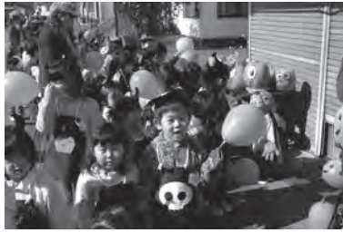
▲平成21年10月 停車場通りハロウィン祭り