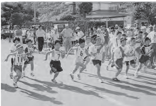
▲平成7年9月 町民駅伝大会(朝日町)