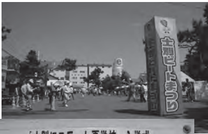
◀平成23年6月 士別ビートまつり初開催