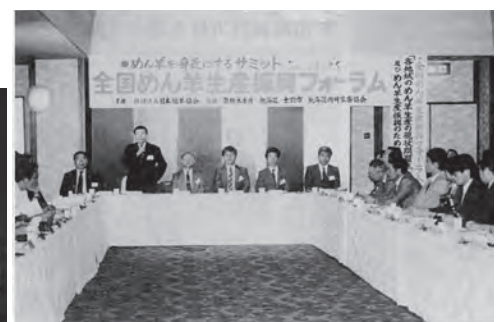
▲平成2年7月 めん羊を身近にするサミット