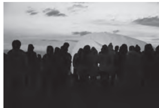
◀平成28年10月 三越伊勢丹CM撮影