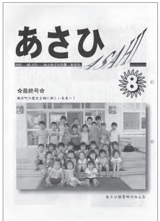
▲平成17年9月 士別市・朝日町が合併し、新「士別市」が誕生