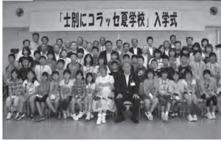
▲平成23年8月 士別にコラッセ夏学校初開催