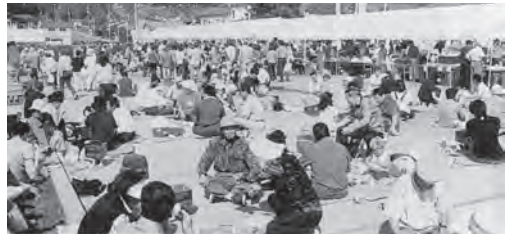
▲平成13年9月 第1回あさひじゃんじゃん ジュビリー