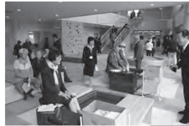
◀平成28年10月 いきいき健康センターオープン