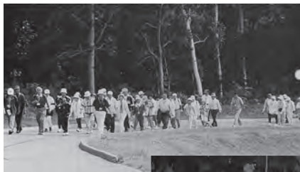
◀平成12年8月 第1回健康ウォーク in 士別

▼平成12年12月 三好町（現みよし市）・ 士別市友好都市提携報告 会（産業フェスタみよし）