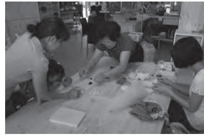
◀平成21年8月 めん羊工芸館くるんオープン