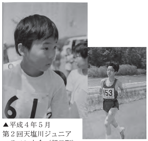
▲平成4年5月 第2回天塩川ジュニアマラソン大会 (朝日町)