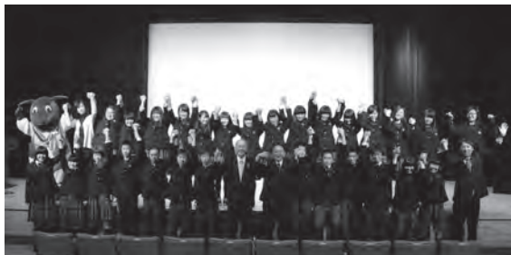
◀平成28年10月 高校生作成のPRCM完成