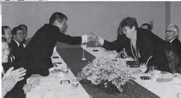
▼平成8年9月 ゴールバーン市士別市 友好親善交歓会