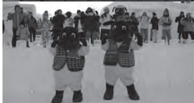
◀平成29年2月 第62回士別雪まつり