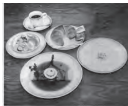
◀▼平成4年5月 羊飼いの家オープン (当時のメニューAセット)