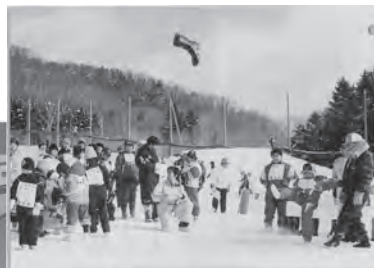
▲平成11年2月 町民冬季スポーツ大会 (朝日町)