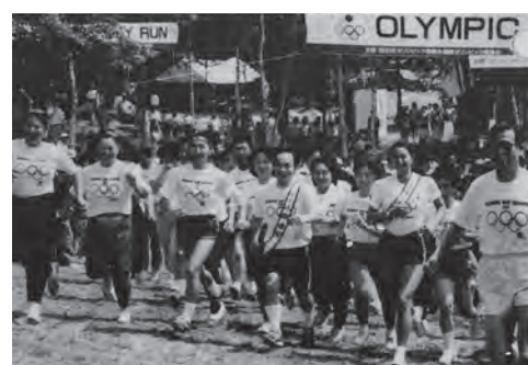
▼平成3年8月 第1回オリンピックデーラン