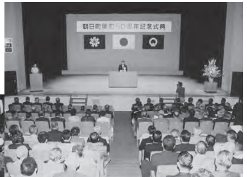
▲平成11年8月 朝日町開町50周年記念式典