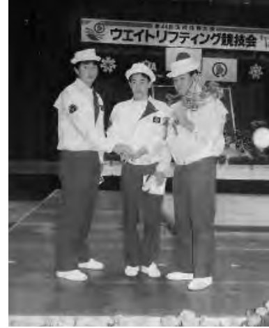
▼平成元年9月 はまなす国体開催