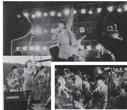
▲平成2年8月 岩尾内ミュージックフェスティバル