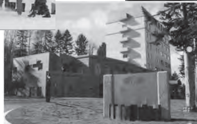
◀平成9年12月 しべ つinn 翠月オープン