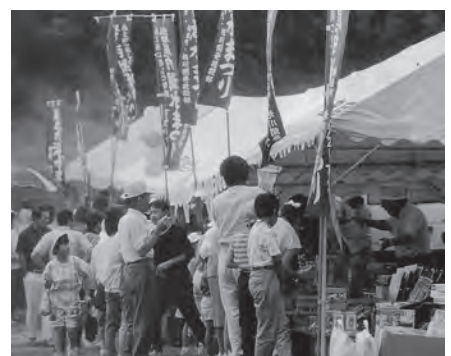
▲平成3年7月 第14回岩尾内湖水まつり