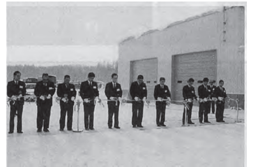
▲平成8年3月 プリヂェストン北海道プールビ ングラウンド完成