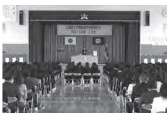
▲平成19年4月 士別翔雲高校開校式