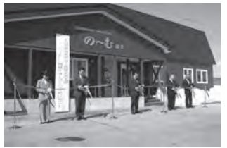
▶平成21年4月 農畜産物加工体験交流工房「のむ」オープン