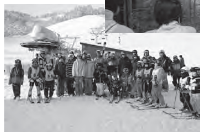
◀平成29年12月 日向スキー場リニューアルオープン