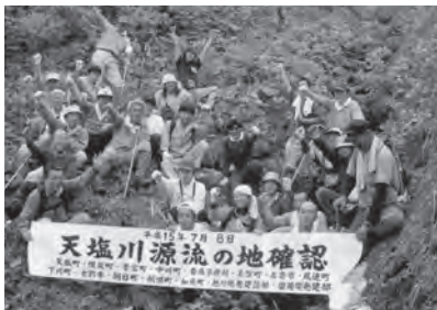
▲平成15年7月 天塩川源流の地を 確認