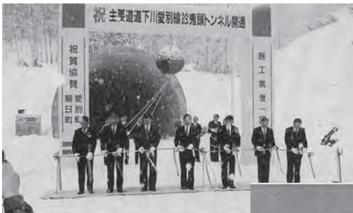
▲平成7年11月 於鬼頭トンネル開通