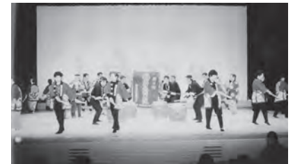
▲平成8年11月 第30 回町民文化祭(あさひの リズム初披露)