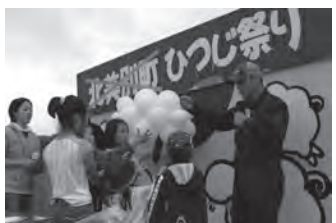
▲平成20年7月 第2回ひつじ祭り開催