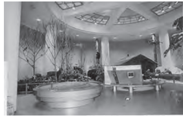
▲平成6年9月 あさひサンライズ ホールオープン