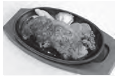
◀▼平成27年4月 羊飼いの家リニューアルオープン