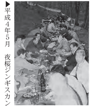
▶平成4年5月 夜桜ジンギスカンパーティー (朝日町)