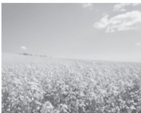
【一面に広がるキカラシ】