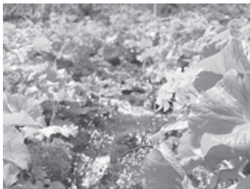
【エゾノリュウキンカの群生】

コースから分岐となる前天塩コース、天塩岳ヒュッテから約1km戻った地点から登る新道コースがあります。