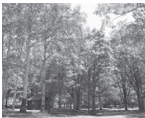
【岩尾内湖白樺キャンプ場】