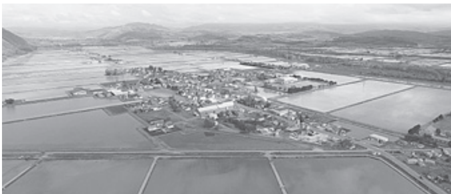
【上士別町の大規模水田】

り入れて進化していく農作業。基幹産業が農業である本市では、移り変わる風景と、進歩し続ける農業を間近で感じられます。