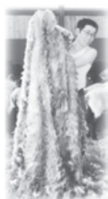
大量に刈れました

羊にはたくさん魅力があると思います。その魅力を少しでも体感していただくため、皆さんが羊ともっと身近に繋がるきっかけをどんどんつくっていきたいです。