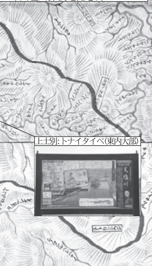
上士別:トナイタイベ(東内大部)