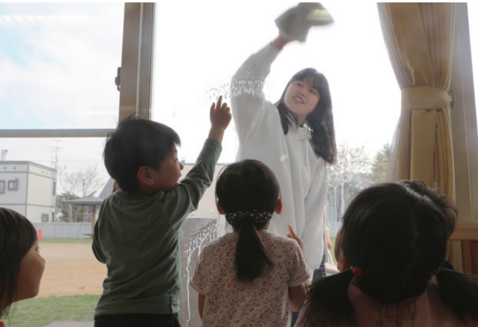
5月9日 士別翔雲高校生ボランティア活動 ～あいの実保育園での窓拭き～