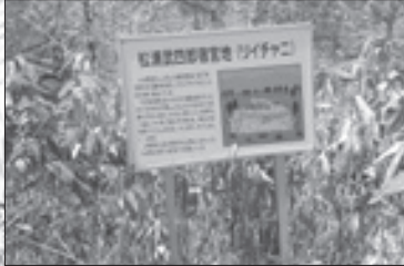
北町:武四郎の宿営地(リイチャニ・ケネフチ)