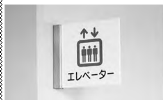
▲ ピクトグラム ▼