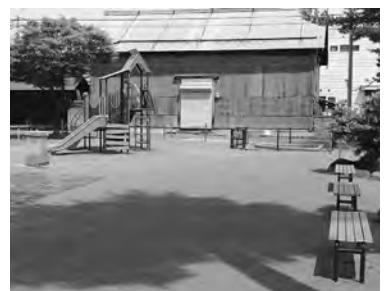
▲丸武児童公園。段差を少なくしてつくられています。

障がい者スポーツのポツチャやゴールボール(※)などのように、障がいの有無にかかわらず誰でもが参加できるような仕組みづくりも、ユニバーサルデザインの考え方に一致します。