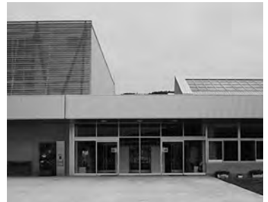
▲糸魚小学校。外部から段差なしで校舎に入れます。