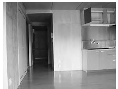
▲北部団地の居室内。段差がなく、安心して生活できます。