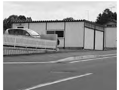
▲段差が少なくなるように改良された歩道。