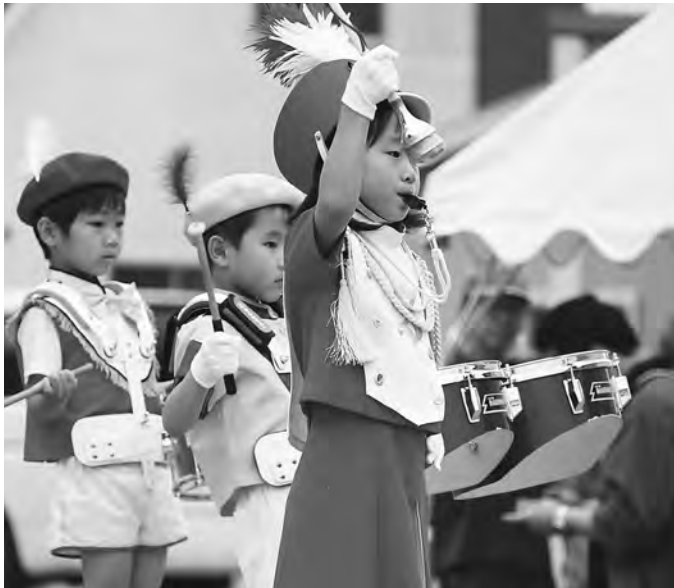
7月1～2日〈ふれあい広場 2017 in しべつ〉 「ノーマライゼーション」をテーマに開催され、多くの来場者が障がいの有無や年齢に関係なく、見て・食べて・体験して楽しみました。