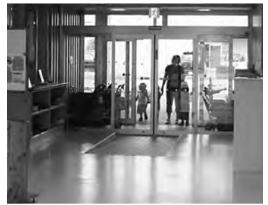
▲あいの実保育園玄関。スロープがメインの玄関です。