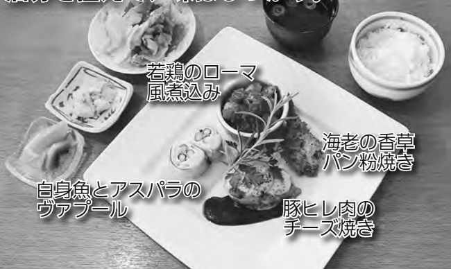
若鶏のローマ風煮込み