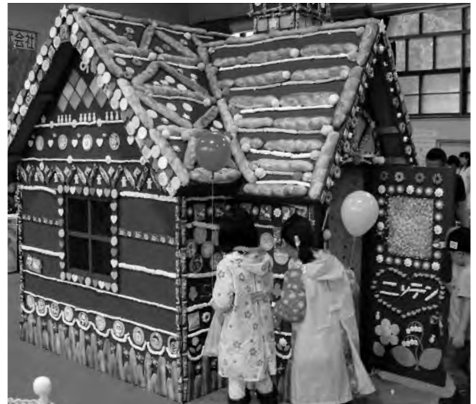
7月2日〈第4回土別ビートまつり〉 4回目をむかえた土別ビートまつり。あいにくの雨模様にもかかわらず、市内外から約3,500人の来場があり、大いに賑わいました。