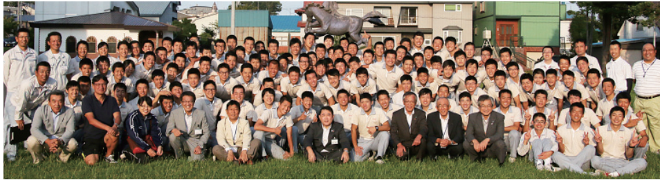
約120人のトヨタ工業学園専門部（平成26年8月）