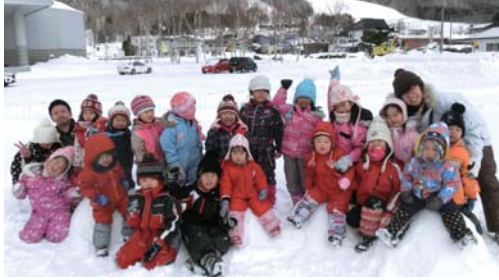
あさひ保育園ゆきんこまつり

の福祉の向上を目的とする。地域の市町村で行われる公共施設や、地域の住民の福祉の向上を目的とする。