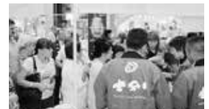
士別ブース前の様子