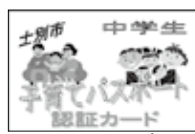
【中学生用パスポート】