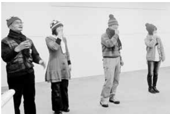
◀平成25年冬の交流会で、猿岩石の歌「白い雲のように」を衣装を揃え手話で歌いました。