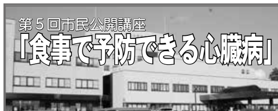
第5回市民公開講座