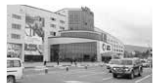
会場のシティーモール