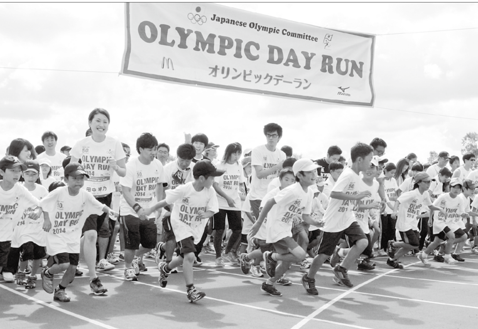
9月7日 オリンピックデーラン士別大会 ～将来の夢は、オリンピック選手?～