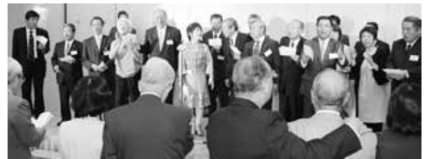
ふるさと士別をおもい、肩を組んでの大合唱