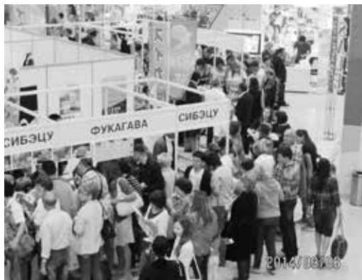
士別特産品ブースの前の行列