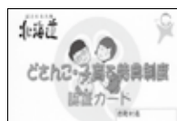
【妊娠中の方・小学生以下用パスポート】