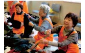
昨年の開催の様子