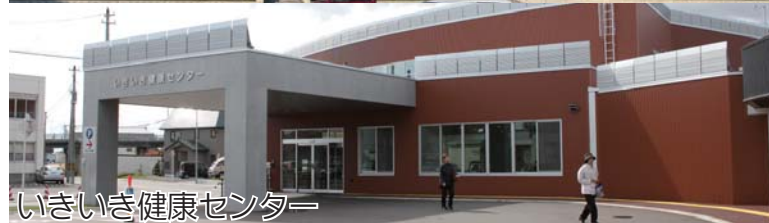
いきいき健康センター