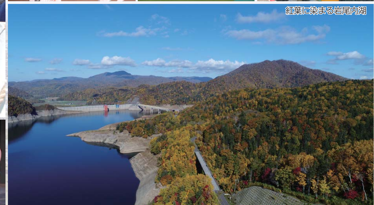
紅葉に染まる岩尾内湖

士別市は北海道北部の中央に位置しています。道立自然公園の「天塩岳」があり、国内4番目の長さの「天塩川」がもたらす豊かな水と肥沃な大地に恵まれ、農業を基幹産業として発展してきました。顔の黒い羊「サフォーク」をまちづくりの中心とした『サフォークランド士別』の取り組みは30年を超え、多くの方に知られています。また、冷涼な気候のもと、国内外のトップアスリートなどが心身を鍛える『合宿の里』としての取り組みを進めているほか、積雪寒冷な自然条件を生かした『自動車等試験研究のまち』として、自動車やタイヤメーカーなどによる試験が盛んに行われています。 Shibetsu is located in northern central Hokkaido. Points of interest ・ Mount Teshio-dake and Japan's fourth longest river, the Teshio River ・ "Suffolk Land"-raising Suffolk sheep for over 30 years ・ Sports training camps-used by elite national and international athletes ・ Automobile test course-conducting vehicle and tire testing in Shibetsu's cold and snowy conditions