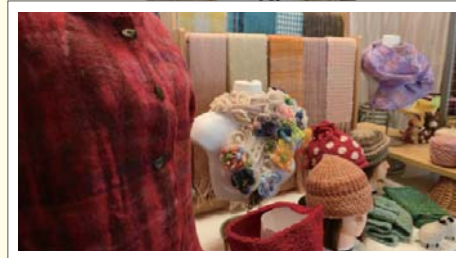
羊毛・ニット製品