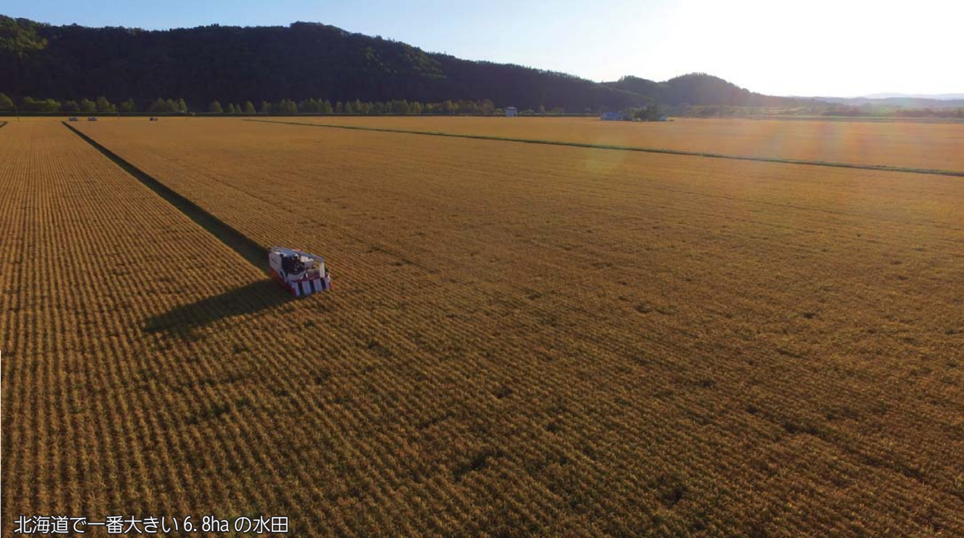
北海道で一番大きい6.8haの水田