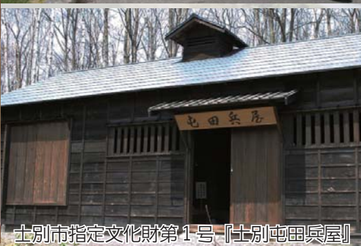
士別市指定文化財第1号『士別屯田兵屋』