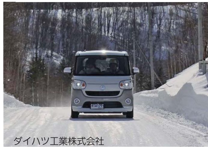
ダイハツ工業株式会社