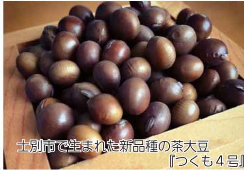
士別市で生まれた新品種の茶大豆 『つくも4号』