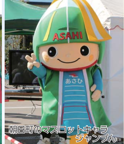
朝日町のマスコットキャラ ジャンプン