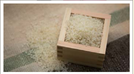
安全安心な農産物