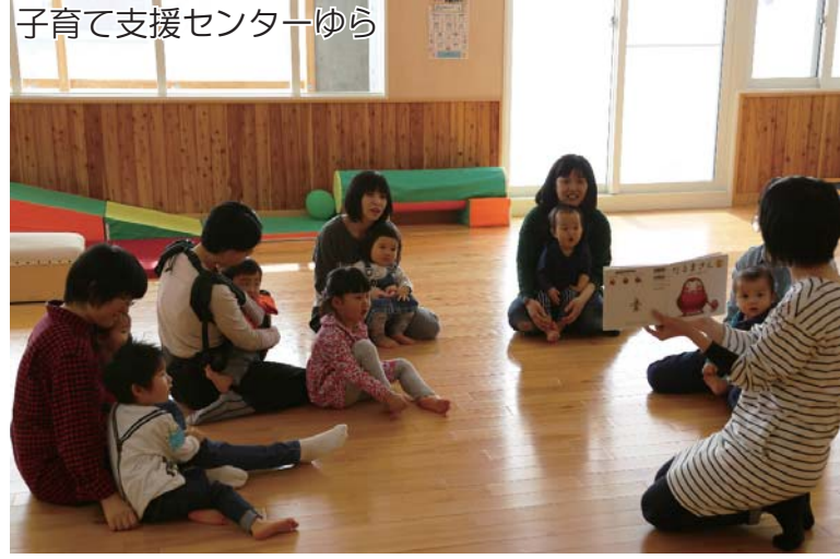
子育て支援センターゆら

Shibetsu is dedicated to providing a safe and family friendly environment. Through Shibetsu's Children's City Council, children have the opportunity to share ideas and their hopes for the future.