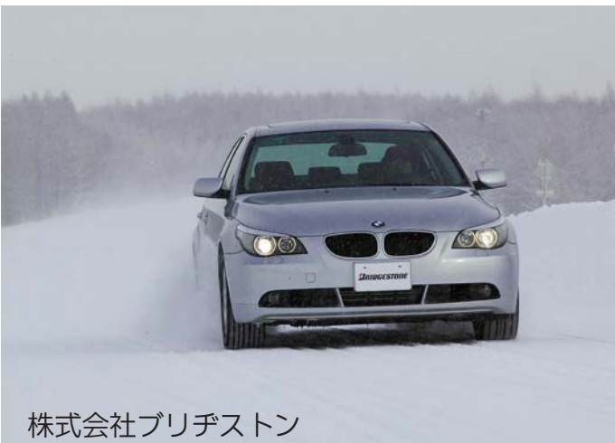
株式会社ブリヂストン