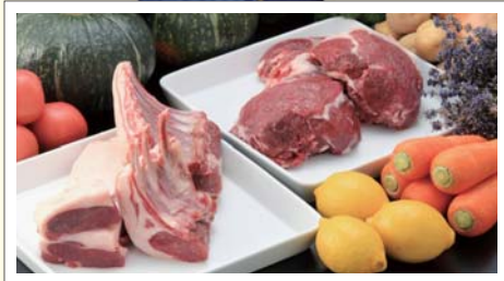
士別サフォークラム