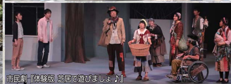
市民劇『体験版 芝居で遊びましょ♪』