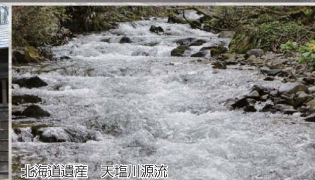
北海道遺産 天塩川源流