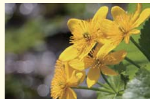
エゾノリュウキンカ (ヤチブキ)