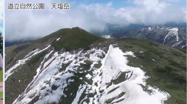
道立自然公園 天塩岳