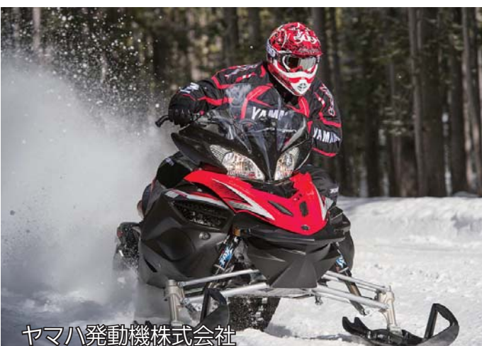
ヤマハ発動機株式会社