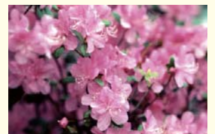
エゾムラサキツツジ