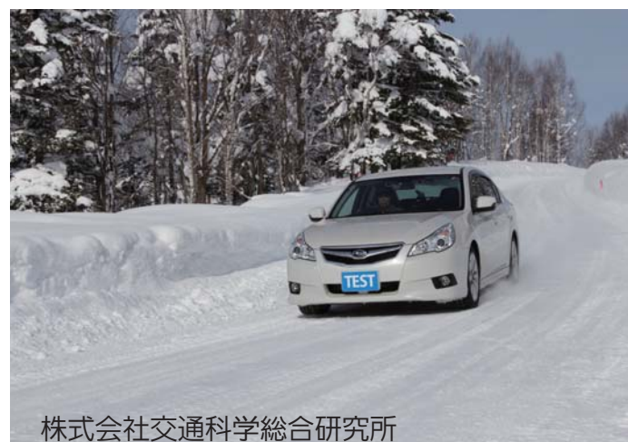
株式会社交通科学総合研究所