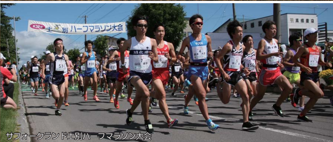
サフォークランド士別ハーフマラソン大会