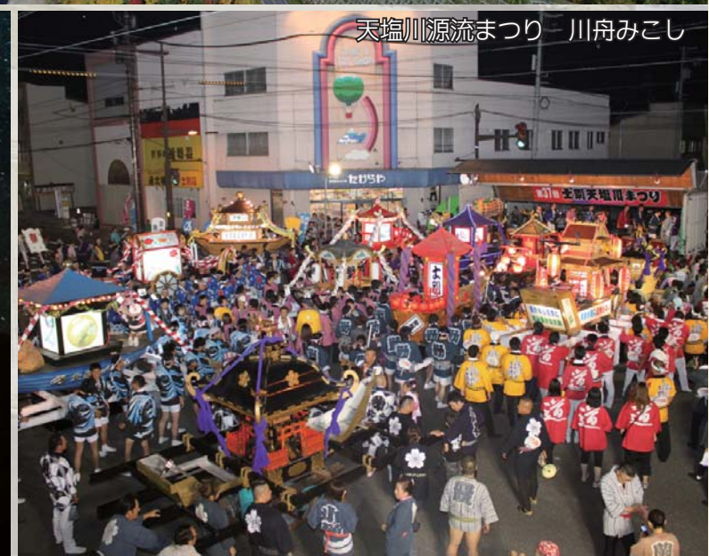
天塩川源流まつり 川舟みこし