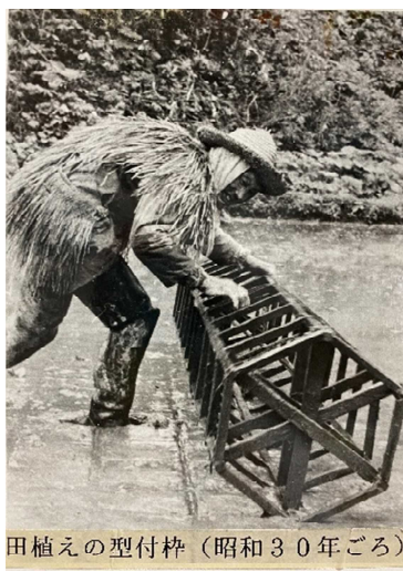
田植えの型付枠(昭和30年ごろ)

7月8日、士別中学校1年生54名が、自分たちの住んでいる地域の歴史や文化を知り、魅力を見つける活動を通して、自分の町への愛着を深める授業の第1弾で朝日町を訪れました。授業内容は岩尾内ダムや町内各所を散策して、クイズやミッションをこなすウォークラリーです。朝日郷土資料室では最初に出された8つの問題を解くのですが、知恵の蔵運営委員さんからヒントをもらいながら解答していました。その一つを紹介します。