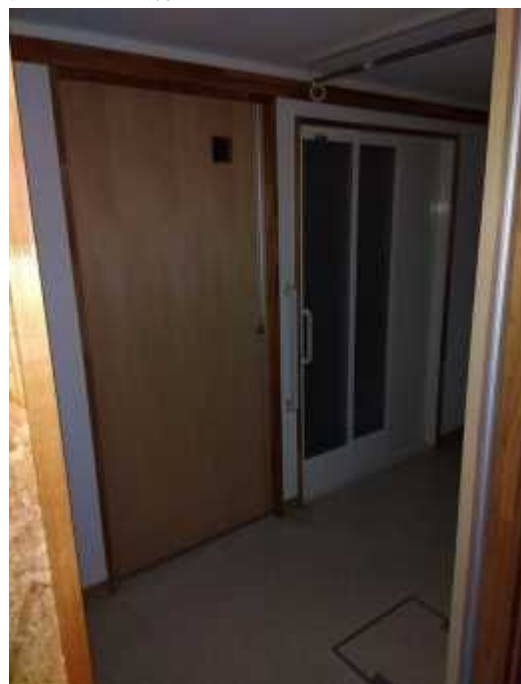
脱 衣 所