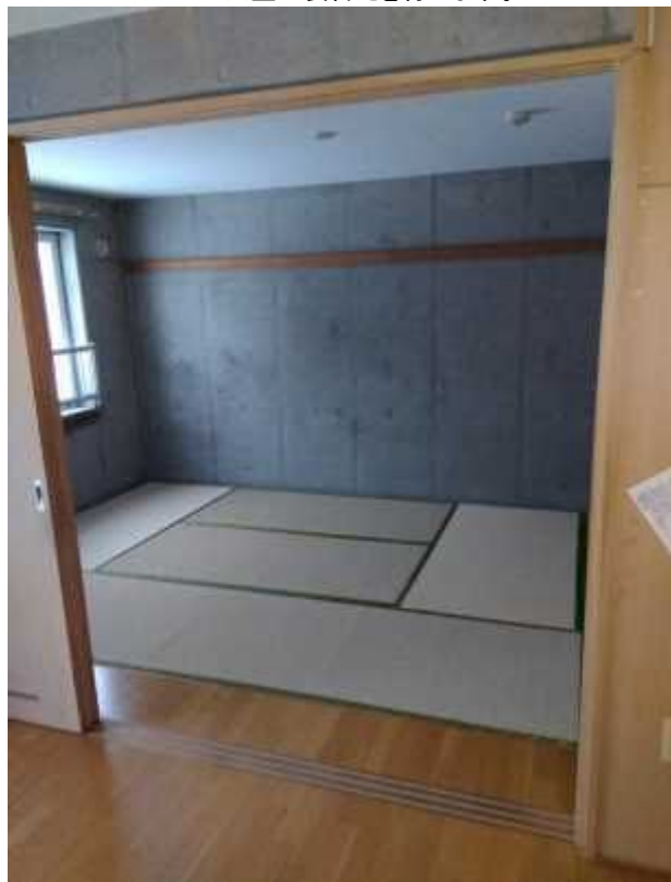
和 室 ※畳は表替えを行います。