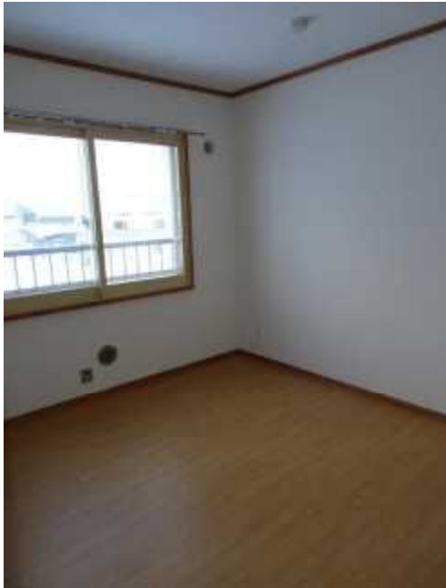
洋 室 1