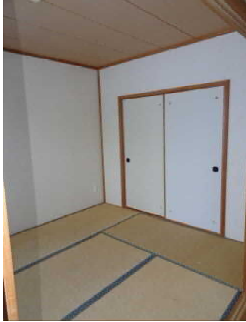
和 室 ※畳は表替えを行う予定です。