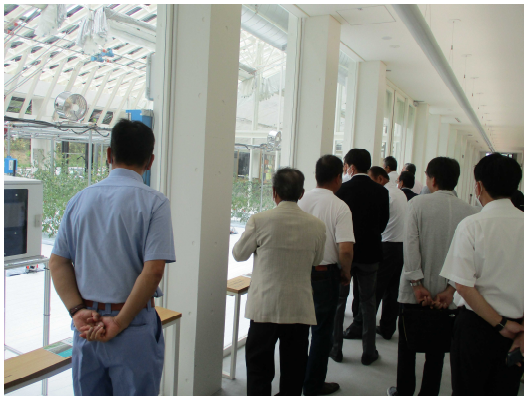
クボタアグリフロント（研修2日目）