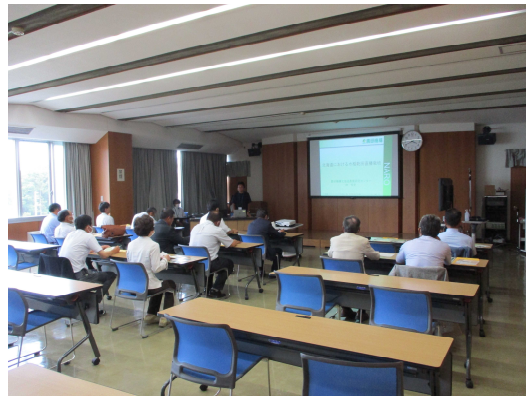
北海道農業研究センター（研修1日目）

2日目は北広島市にあるクボタアグリフロントを視察しました。ファイターズの新球場エスコンフィールド北海道と同じ敷地内にある新しくできた施設です。6月30