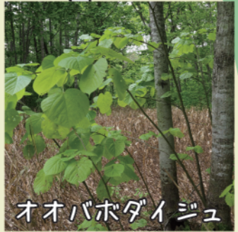
オオバボダイジュ