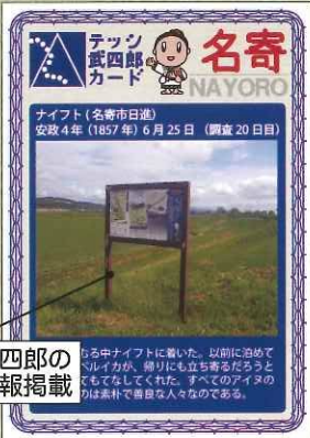
松浦武四郎の軌跡情報掲載