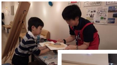
↓ゴム鉄砲～輪ゴムを自由に操ろう～