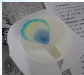
↑ペーパークロマトグラフィー