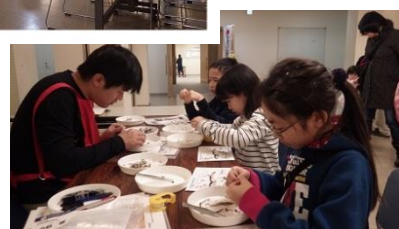
↑環境にやさしいせっけんづくり