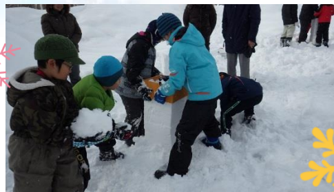
↑スノータワーづくり

また野外では雪を利用してのスノータワーづくりや、カップに雪を詰める競争を行ったりと、子ども達は様々な実験や体験を楽しんでいました。