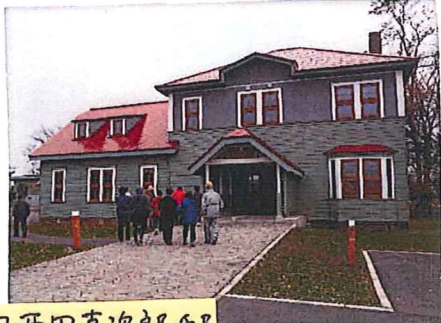
旧西田直次郎邸 (名寄市)

士別市、名寄市、下川町に遺る古建築や史跡等の近代産業遺産をバスで巡見しながら、天塩川上流域の歴史について講師から解説を受けました。普段はなかなか見ることができない建築物等が多くあり、参加者の皆さんはその一つ一つに興味が深げに見学されていました。