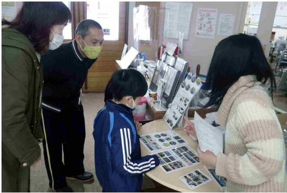
▲「しべつクイズラリー」答え合わせの様子

今後も多くの皆さまに利用いただける、地域に開かれた博物館を目指して邁進してまいりますので、より一層のご来館、ご支援をお願い申し上げます。