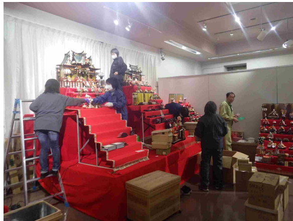
ひな人形展示作業ボランティア