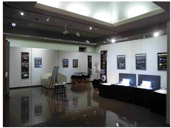
テーマ展「透明標本と骨格標本の世界」