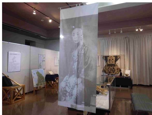
特別企画展「武四郎が見たアイヌの世界」