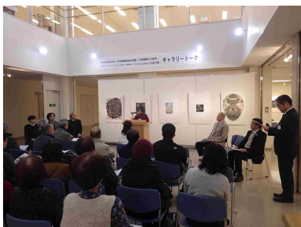
レジデンス成果展 「ギャラリートーク」