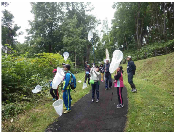
文化村「昆虫採集と標本づくり」