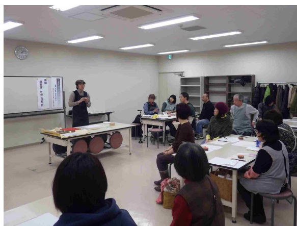
レジデンス WS「木口木版画体験」