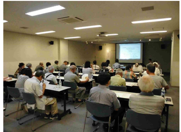
特別展関連講座「武四郎が見たアイヌの世界」