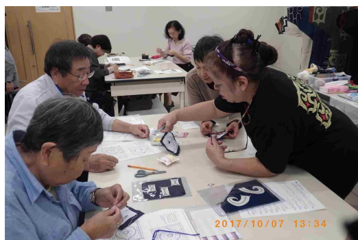
講座「アイヌ文様の刺繍ワークショップ」