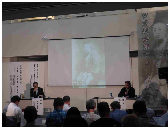
特別展関連講座「武四郎フォーラム」