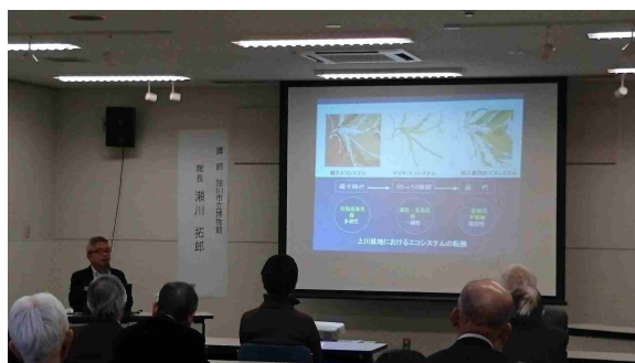
郷土研究会講演会「上川のアイヌの歴史」