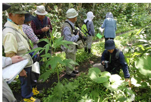
講座「士別の草花しらべ」