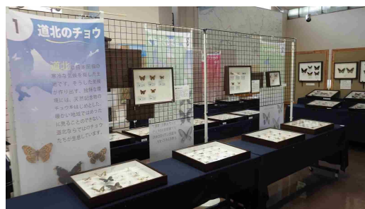
テーマ展「道北の蝶・世界の蝶」