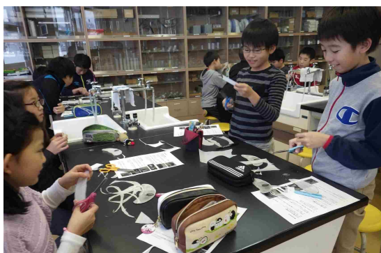
出前講座「飛ぶ種の模型を作ろう」