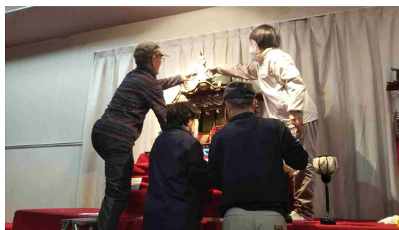
ボランティア活動「ひな人形展示作業」