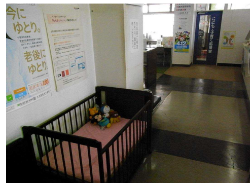
▲ 現庁舎の窓口の様子