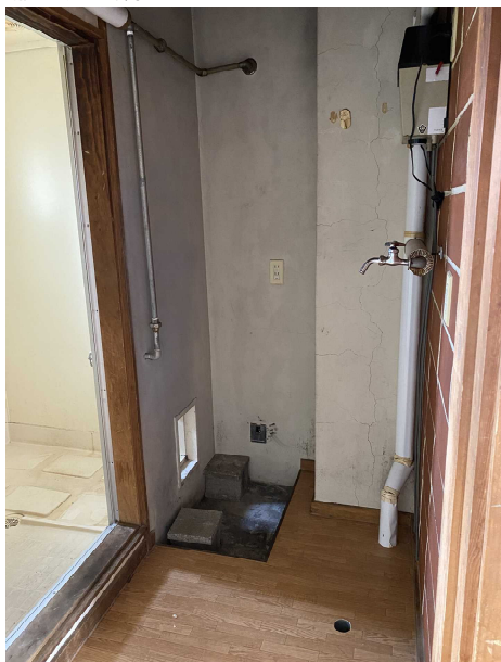
脱 衣 所