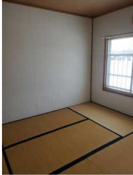
和 室 1 ※畳は表替えを行う予定です。