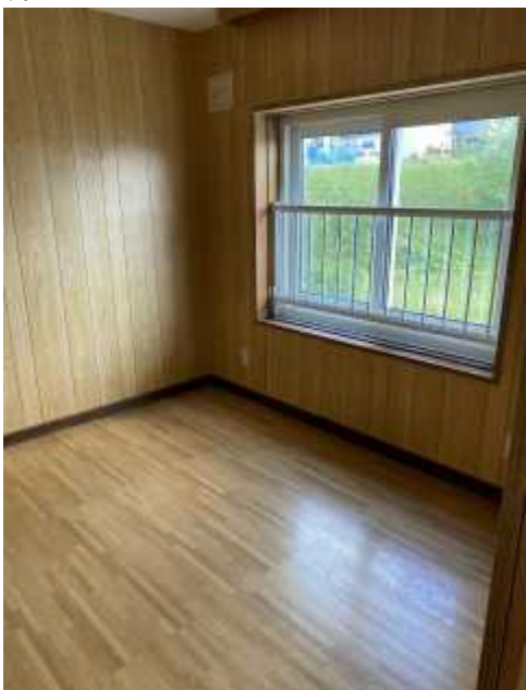
洋 室 1