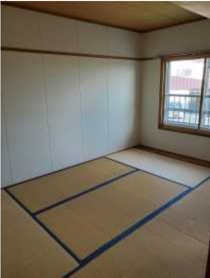
和 室 1