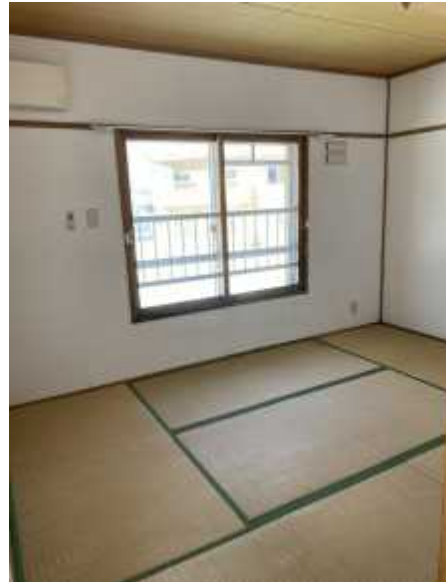
和 室 2