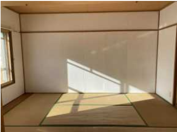
和 室 1