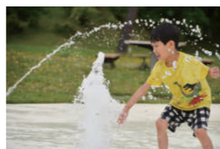
子どもたちのお気に入り(つくも水郷公園)ゴーカートやボート、鯉のエサやりをはじめ、水遊びができます。

「幼稚園、保育園の選択肢も多様で、それぞれの方針を比較できるのが良い部分だと思います。中には給食のある幼稚園もあります。」と教えてくださいました。