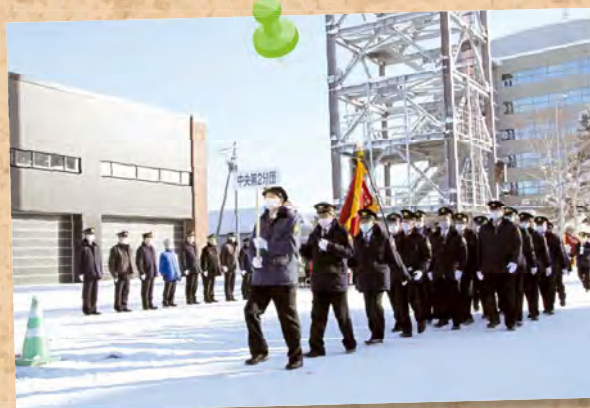
▲士別市消防団の団員が一堂に会し、 出初式が行われました！