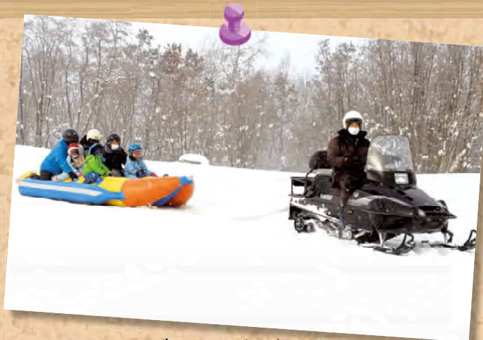
▲スノーモビルランドへ行こう！ 詳細は本紙お知らせ 18 ページ♪