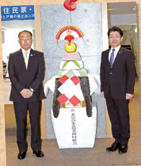
▲今年度も、北ひびき農業協同組合より 特大鏡もちを寄贈いただきました！