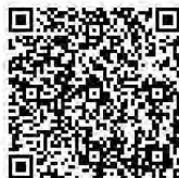
「市長へのメール」 QRコード