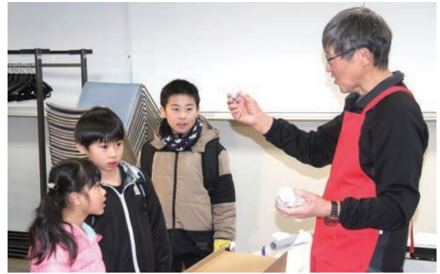
▲科学の不思議を知ろう！サイエンスフェスティバルが行われました。