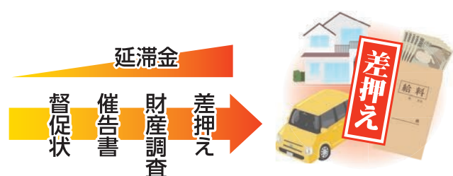
《令和6年度の差押え実績》 ※カッコは前年度比

財産の差押えは、預貯金や給与のほかにも、自動車などの動産、土地や建物などの不動産、確定申告で発生する国税還付金など幅広い財産が対象となります。