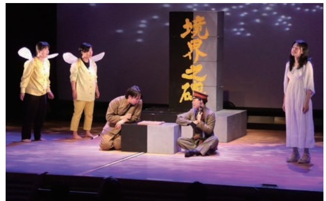
▲学校の先生や児童生徒と一緒に演劇をつくる「センセイノチカラ」が上演されました。