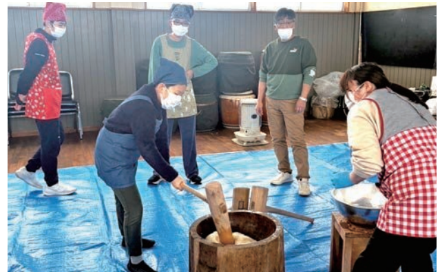
▲お正月恒例の温根別もちつきが行われ、子どもたちは自分でついた餅を美味しく食べました。