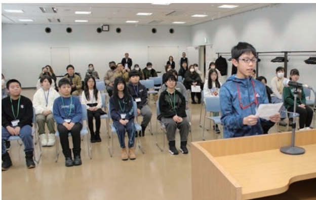
▲今回で最後となる友好都市・みよし市への小学生派遣が行われ、両市の子どもたちが交流しました。