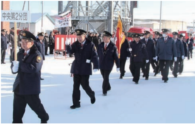
▲消防出初式が行われ、消防団員たちが整列して行進しました。