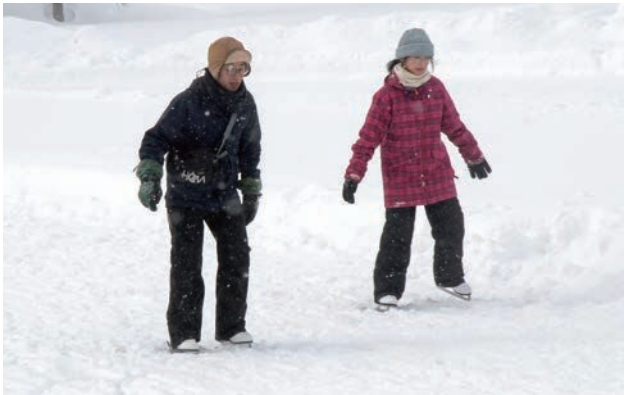
▲つくも水郷公園のスケートリンクとすべり台がオープンしました。遊びに行こう！