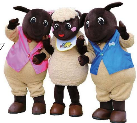
エントリーNo.611 さほっちファミリー